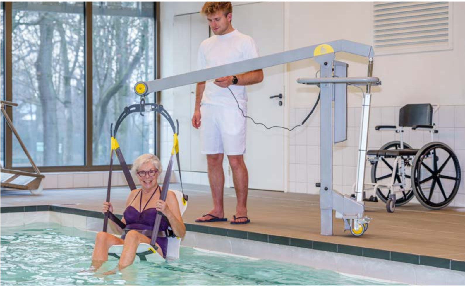
~ Lève-personne de piscine avec siège